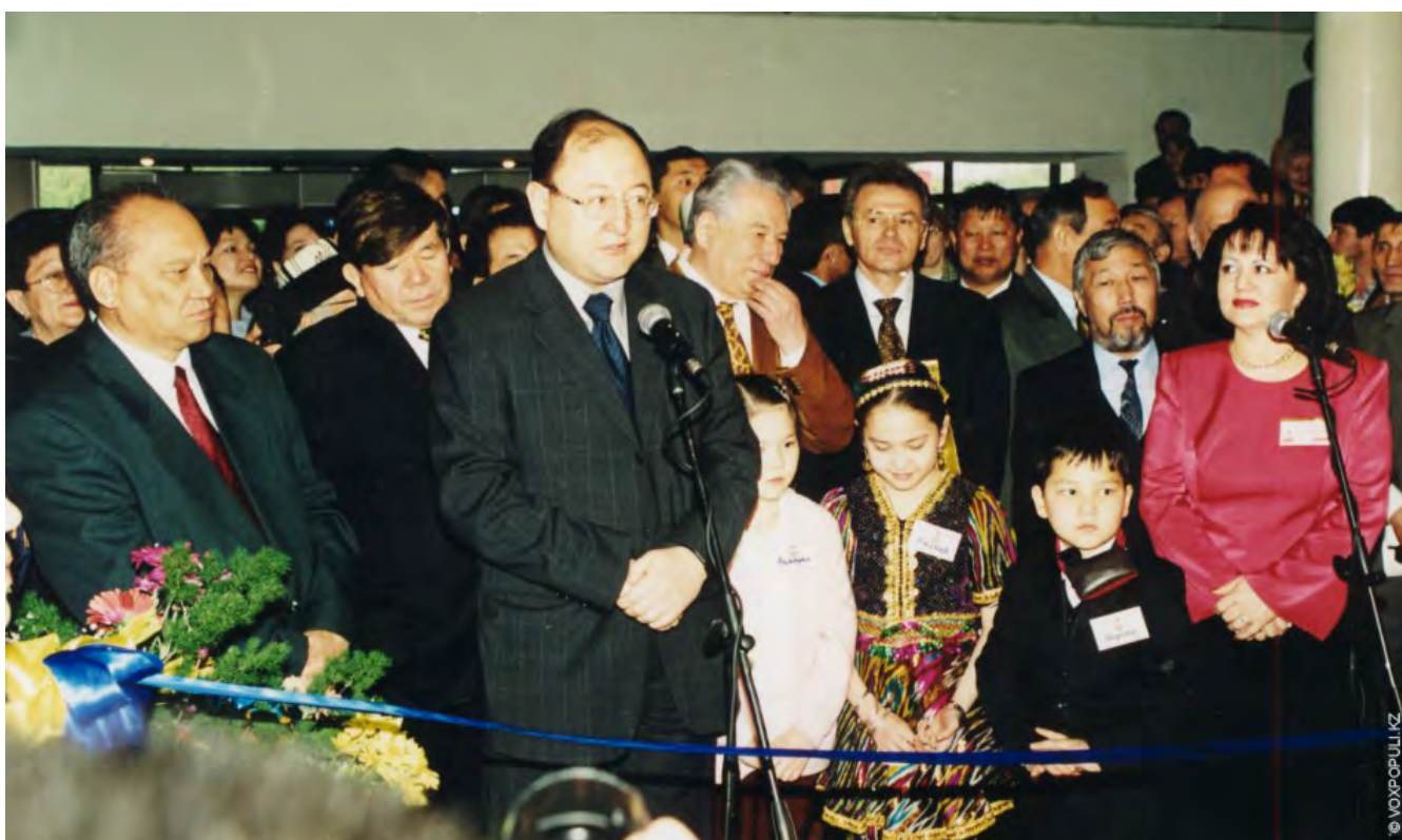
Переезд Агентства информации РК в г. Астану. 1996 год.

Именно в бытность Сарсенбаева министром в Казахстане сначала произошел расцвет независимых СМИ, а потом государство предприняло попытки максимально эту сферу регулировать. В 1998 году в стране прошел тендер по повторному распределению телевизионных и радиочастот, в результате которого десятки телерадиостанций были вынуждены закрыться. Уже будучи в оппозиции, Алтынбек Сарсенбаев принес извинения журналистам за этот шаг.