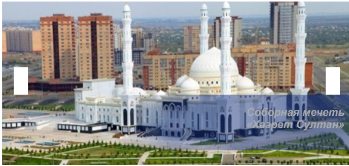
Соборная мечеть «Хазрет Султан»