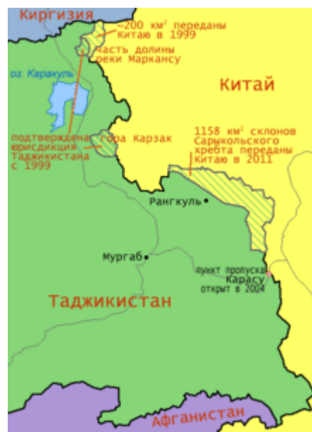
Изменения китайско-таджикской границы

После образования Таджикистана в 1992 году в результате распада СССР КНР заявила о необходимости подписания нового договора о границе и пересмотреть некоторые демаркационные линии. В мае 2004 года, в соответствии с подписанным правительствами Китая и Таджикистана соглашением, открылся первый контрольно-пропускной пункт на китайско-таджикской границе — КПП «Карасу». 12 января 2011 года парламент Таджикистана проголосовал за передачу Китаю тысячи квадратных километров спорных территорий в горах Памира . 6 октября 2011 года завершился процесс передачи таджикской территории под юрисдикцию Китая 1 тыс. 158 квадратных километров, что составляло 5,5 % всех спорных территорий.