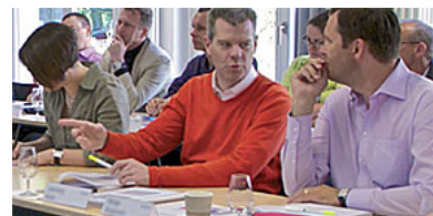
Executive Master of Public Administration der Universität Bern