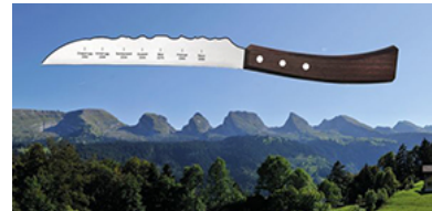
So scharf war Ihre Grillparty noch nie.