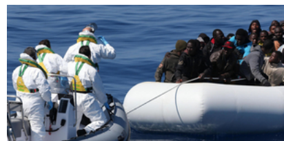
Die Schweiz will die EU-Retter unterstützen. Aber wie?