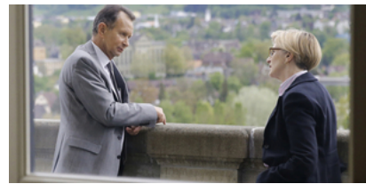
Die FDP trage Sorge zur Umwelt, sagt ihr Präsident. Wahr ist das Gegenteil.

Wer lügt? Wer sagt die Wahrheit? Die Kommunikationsagentur hält vorderhand zu ihrer Mitarbeiterin. Wie gross die Loyalität tatsächlich ist, bleibt allerdings offen. In einer ersten Stellungnahme distanzierte sich Burson-Marsteller von Baumann. Wenige Stunden später wurde das Communiqué ausgetauscht und dessen Inhalt ins Gegenteil verkehrt. Die