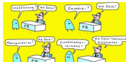
Die Bürgerlichen gewinnen wahrscheinlich die Wahlen. Und verlieren den Verstand.