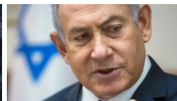
"Kennt sich aus mit Terror" Netanyahu greift Erdogan nach...