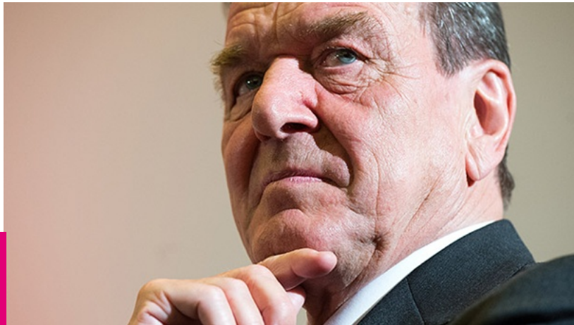
Hat Altkanzler Gerhard Schröder für seine Beratungstätigkeit des kasachischen Regimes doch Honorare erhalten?