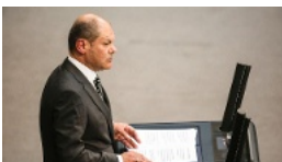
"Veritabler Fehlstart" Opposition zerfällt, Schulz...