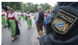
Streit um Gesetz in Bayern "Mit einer hübschen Polizei...